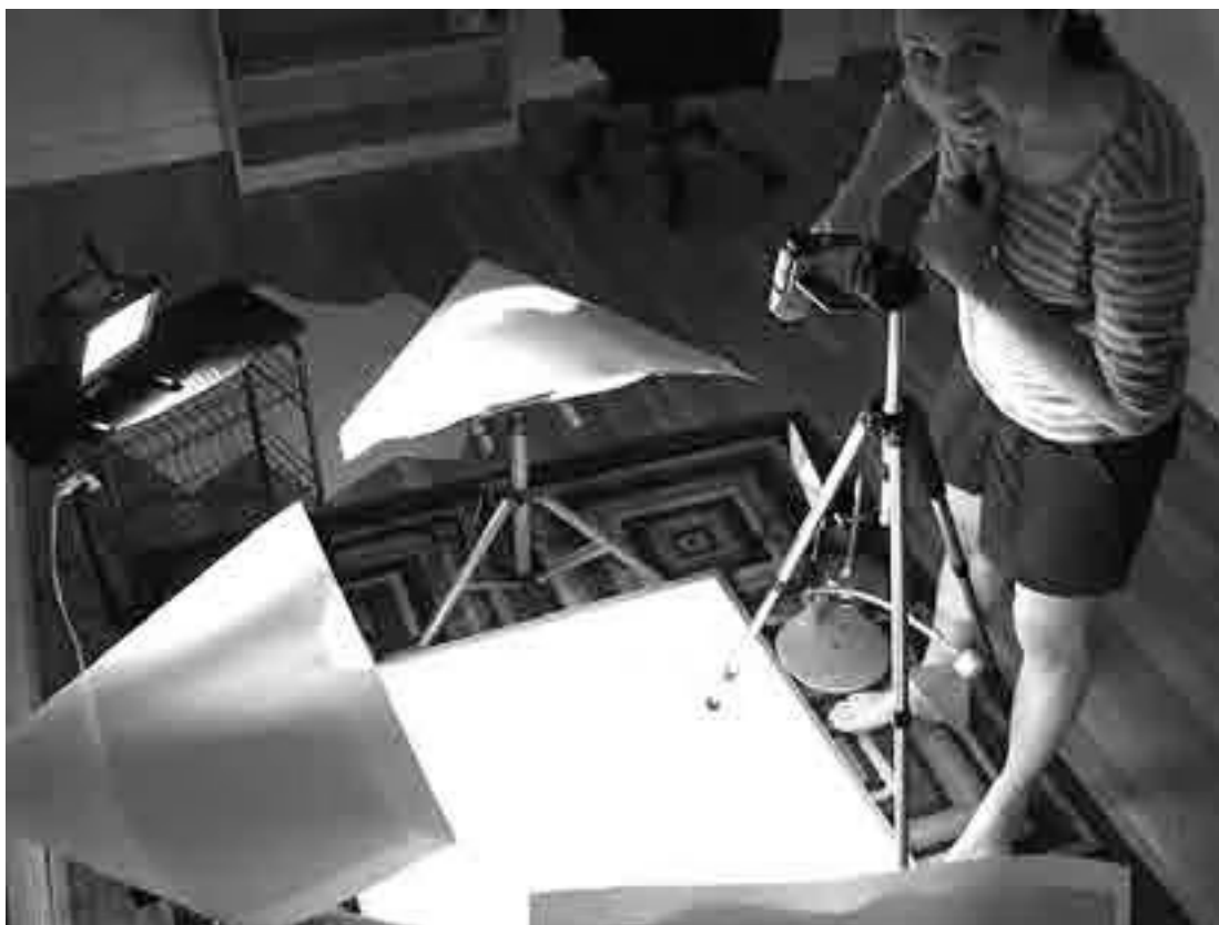
Сати в нашей второй студии, лето 2007 года

В апреле мы разместили его на YouTube, и ролик сразу стал хитом. В первый день его просмотрели десятки тысяч раз, мы получили массу электронных писем, комментариев и отзывов на нашу работу в блоге. Люди призывали нас продолжать делать видеоролики. Это был один из лучших дней в моей жизни. Наше объяснение завоевало такую популярность, потому что помогло людям понять, что такое канал RSS, позволило посмотреть на проблему с иной точки зрения.